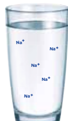
AGUA PARCIALMENTE DESMINERALIZADA