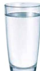
AGUA TOTALMENTE DESMINERALIZADA/ AGUA TRATADA CON ÓSMOSIS