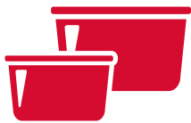
RECIPIENTES DE PLÁSTICO