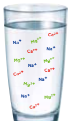
AGUA NO TRATADA