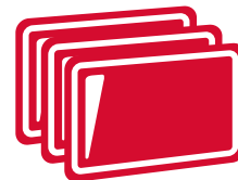
CHAPAS DE ALUMINIO